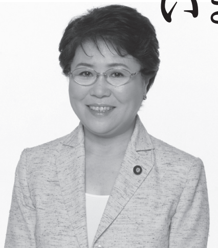
神本美恵子参議院議員（当日ゲスト予定）